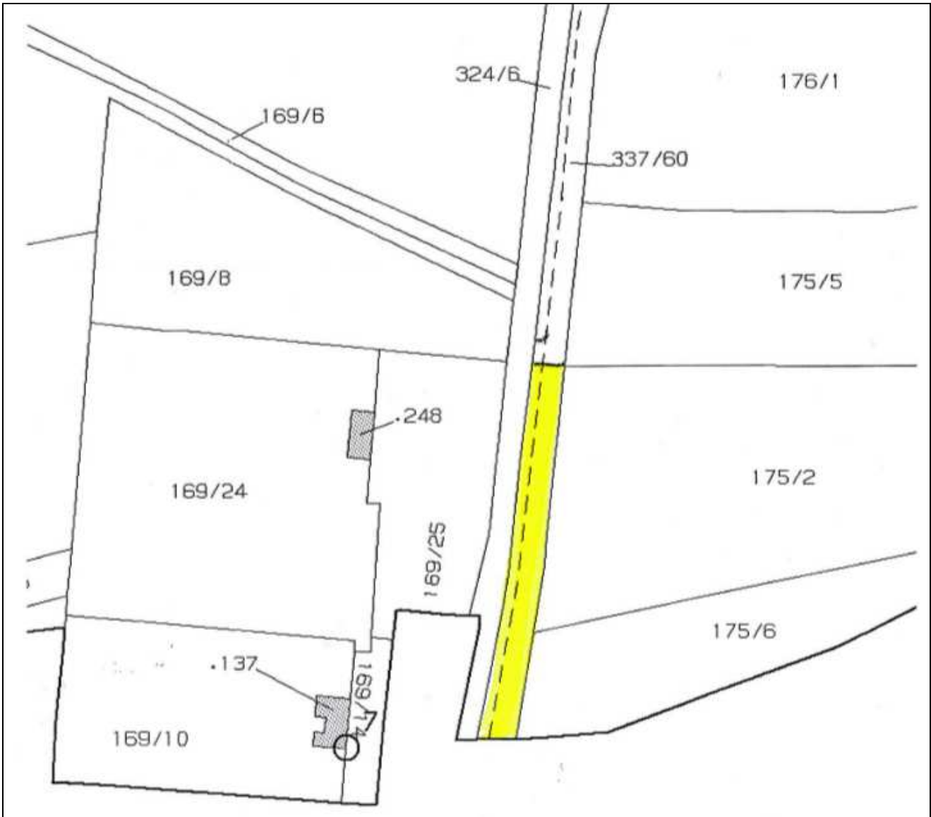
Estratto di mappa F.M. 1