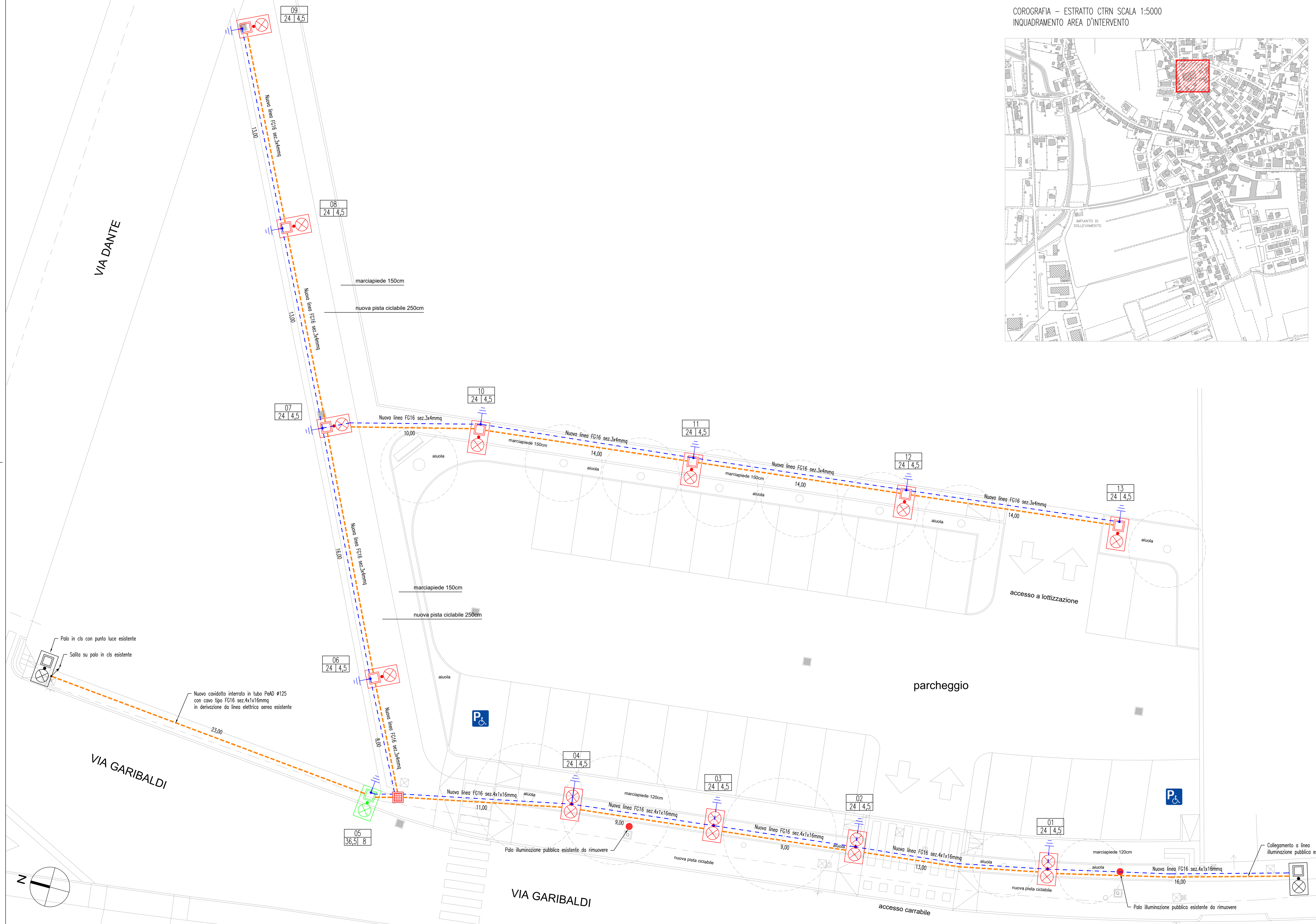
COROGRAFIA – ESTRATTO CTRN SCALA 1:5000 INQUADRAMENTO AREA D'INTERVENTO